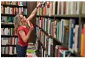
Buchhandlung «Das Narrenschiff»